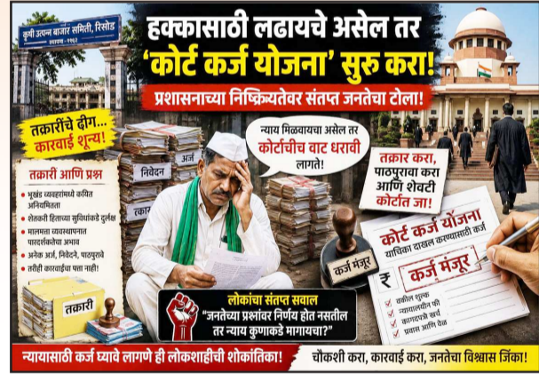
न्यायासाठी कर्ज घ्यावे लागणे ही लोकशाहीची शोकांतिका! चौकशी करा, कारवाई करा, जनतेचा विश्वास जिंका!

रिसोड कृषी उत्पन्न बाजार समितीशी संबंधित विविध तक्रारी, निवेदने आणि अर्ज स्थानिक कार्यालयांपासून जिल्हास्तरीय कार्यालयांपर्यंत पोहोचल्याचे सांगितले जाते. अनेक प्रकरणांमध्ये वारंवार पाठपुरावा करूनही अपेक्षित निर्णय किंवा कारवाई होत नसल्याची भावना तक्रारदारांमध्ये आहे. त्यामुळे प्रशासकीय यंत्रणेच्या कार्यक्षमतेवर प्रश्नचिन्ह उपस्थित केले जात आहे.