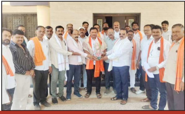
सर्वसामान्यांचे प्रश्न सोडविण्यासाठी कटिबद्ध

बैठकीत पक्षाची ध्येय-धोरणे, संघटनात्मक बांधणी तसेच पक्ष विस्ताराबाबत सविस्तर मार्गदर्शन करण्यात आले. आगामी काळात पक्ष संघटना अधिक बळकट करण्यासाठी सर्व पदाधिकारी व कार्यकर्त्यांनी एकदुटीने कार्य