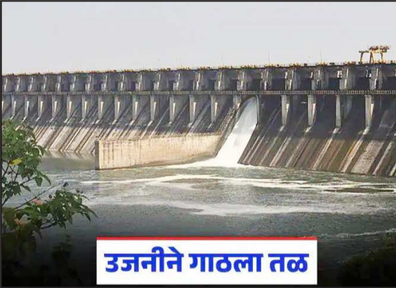
उजनीने गाठला तळ

मुंबई : उन्हाळा अखेरीला येईल तसा उजनी धरणाचीपाणी पातळी तळ गाठायाला सुरुवात झाली असून, सध्या वजा १७.७ टक्क्यांपर्यंत खालावली आहे. पुढील दोन महिने चिंतेचे असून, पुणे जिल्ह्यात पडणाऱ्या पावसावर सोलापूर जिल्ह्याचे भवितव्य अवलंबून असणार आहे. उजनी धरणात ५४.४६ टीएमसी पाणीसाठा शिल्लक राहिला आहे. गतवर्षी पडलेल्या मान्सूनपूर्व पावसाने उजनी धरणाची पाणी पातळी वाढण्यास सुरुवात झाली होती. यावर्षी हवामान खात्याने अल्प प्रमाणात व ठराविक अंतराने पाऊस पडणार असल्यामुळे सोलापूर जिल्ह्याचे भवितव्य पुणे जिल्ह्यातील भीमा खोऱ्यात पडणाऱ्या मान्सूनच्या पावसावर अवलंबून असणार आहे.