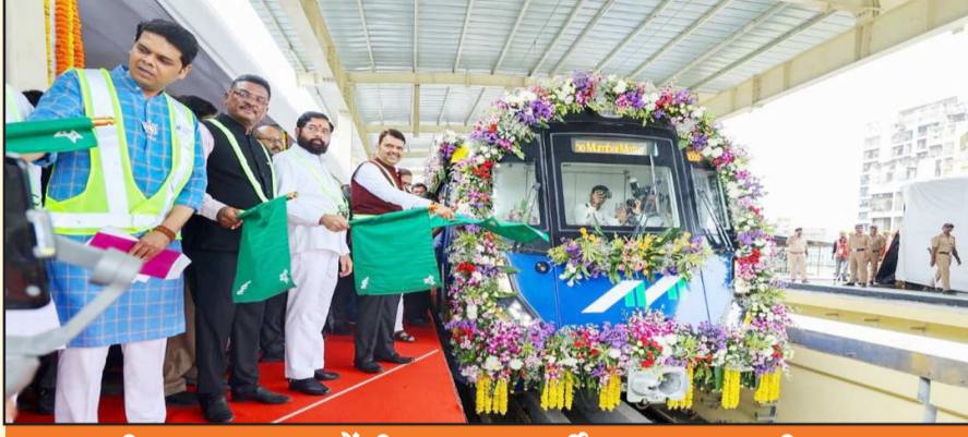
ठाण्यातील वाहतूक कोंडीचा प्रश्न मार्गी लावण्यासाठी हा प्रकल्प महत्त्वाची भूमिका बजावेल - उपमुख्यमंत्री एकनाथ शिंदे

मेट्रो मार्ग ४ (वडाळा-कासारवडवली) व ४ अ (कासारवडवली-गायमुख) च्या टप्पा-१ गायमुख जंक्शन गायमुख गाव- घोडबंदर रोड-कासारवडवली-विजय गार्डन या मार्गिकेच्या प्राधान्य विभागावर तांत्रिक तपासणी व ट्रायल रनची सुरुवात मुख्यमंत्री देवेंद्र फडणवीस यांच्या हस्ते करण्यात आली, त्यावेळी ते बोलत होते. यावेळी